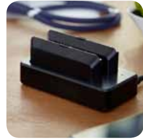
Dock it ...