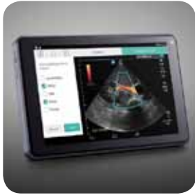
Bring it ....