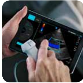
Use it ....